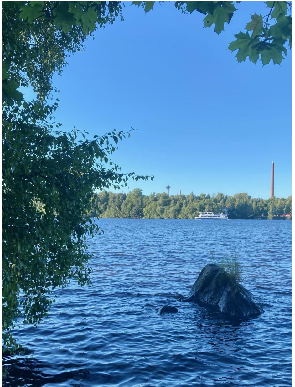
Kuva: Mari Leskinen